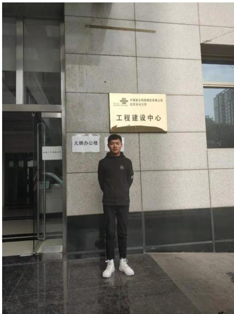
【北京 移动通信网络规划工程师】