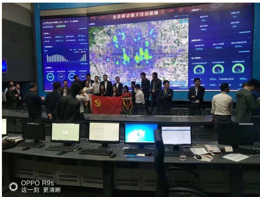
【北京重大活动保障后台】