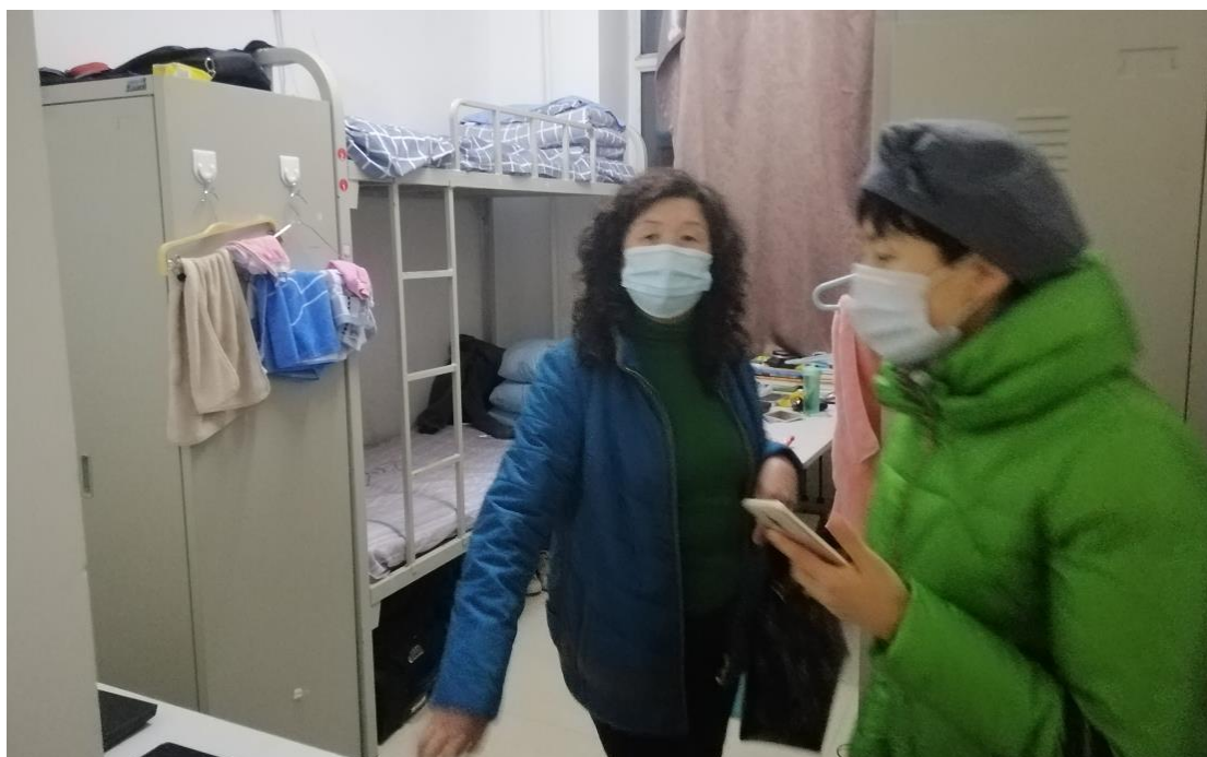
上图为 5 楼工作组在检查