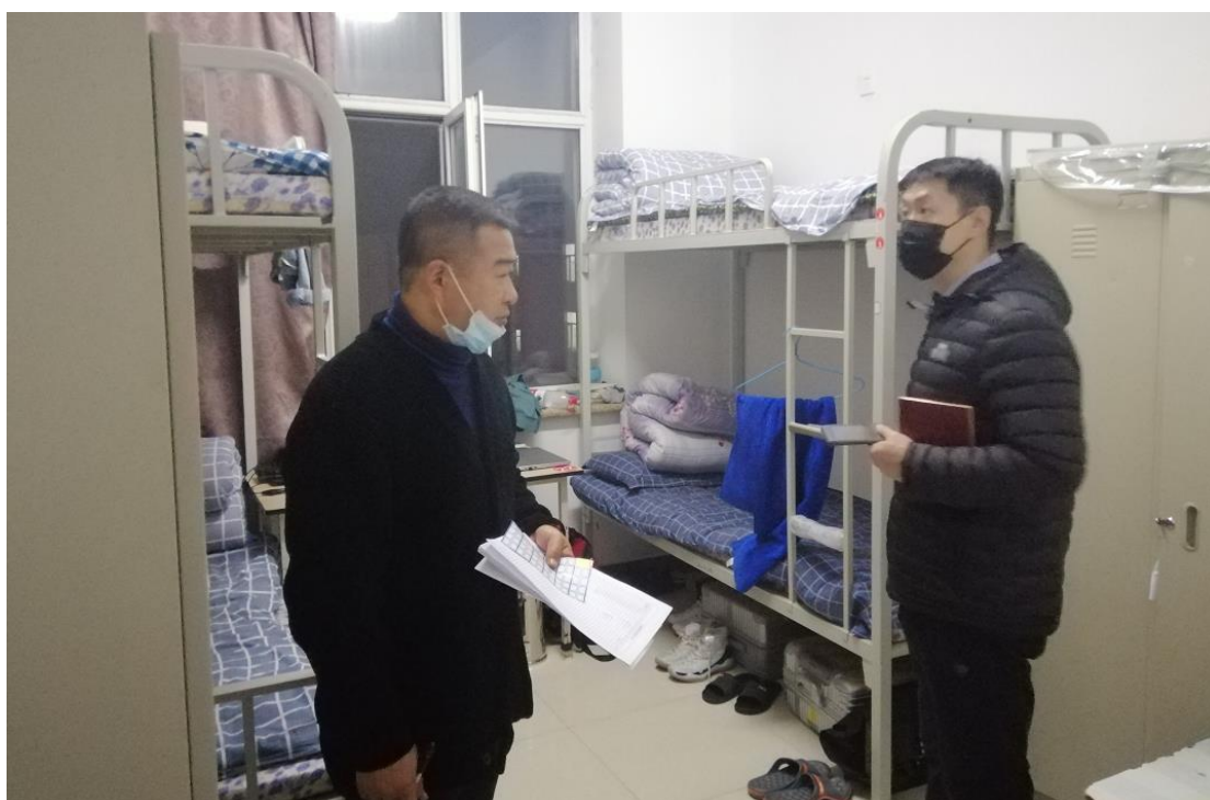
上图为 6 楼工作组在检查

检查公寓均为 2020 级软件学院男生寝室，受检寝室整体卫生情况较好，学生讲文明、懂礼貌，在整个迎检的过程中展现了良好的精神风貌。但部分寝室仍存在人离开寝室插排不断电的现象，仍有充电宝、手机、电脑与电源相通的现象，