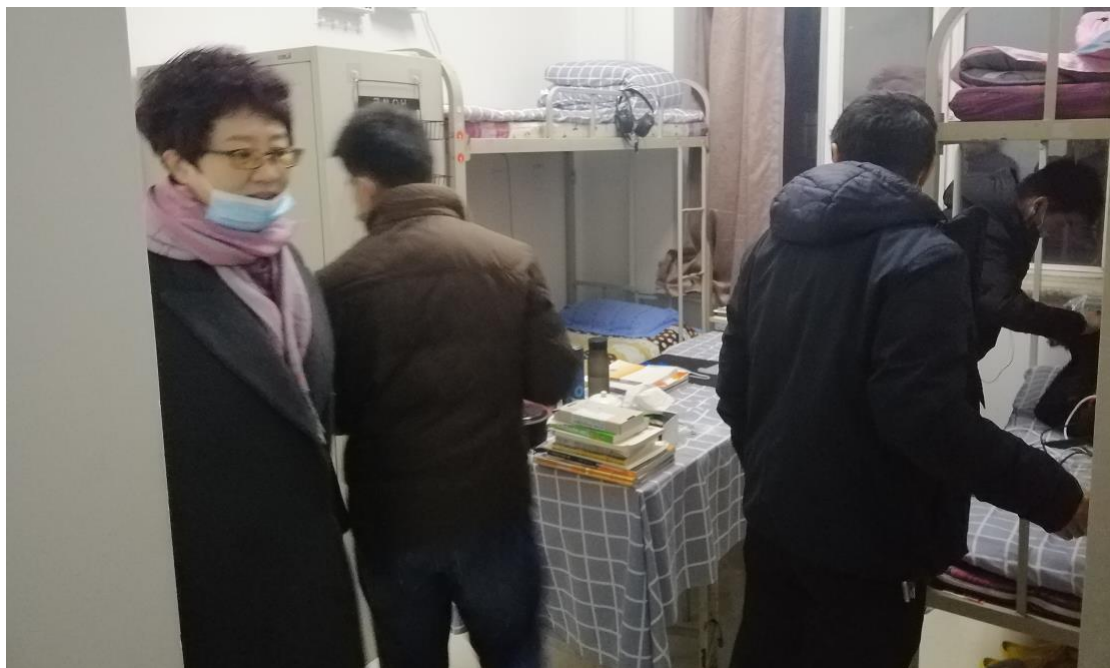
上图为 3 楼工作组在检查